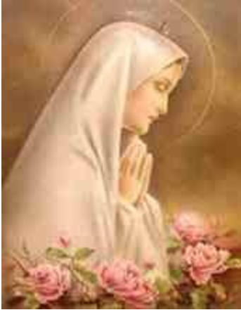
Nossa Senhora das Rosas

Como vemos, essas denúncias são gravíssimas, pois Maria Santíssima cita nomes de três prelados diretamente ligados ao Papa, personalidades eminentes da alta hierarquia do Vaticano.