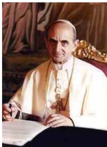
Nossa Senhora das Rosas denunciou: "Teu Vigário é prisioneiro..."

Sabe-se que João Paulo I tinha em mente investigar a fundo as denúncias e os escândalos que pipocavam nessa época comprometendo autoridades clericais da alta hierarquia católica. Entre