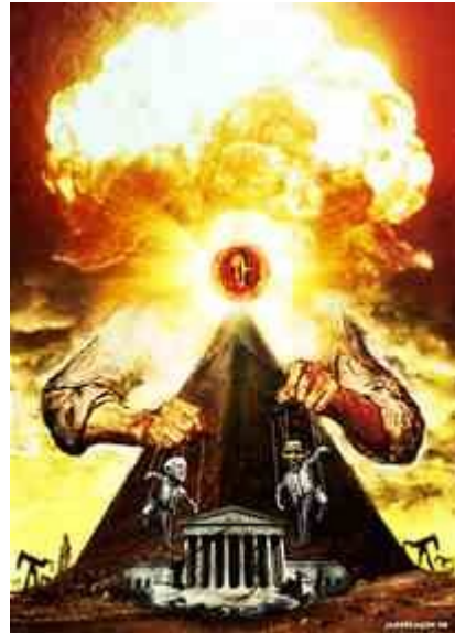
A Virgem em Bayside bateu forte e de frente com as conspirações dos iluministas e sua “ hegemonia ” anti-religiosa, “ impregnada de controle ” mental e físico

Nossa Senhora das Rosas profetizou que “ o assassinato de 16 milhões de bebês norte-americanos no útero ” aconteceria por causa da enorme falta de julgamento, moral e responsabilidade individual