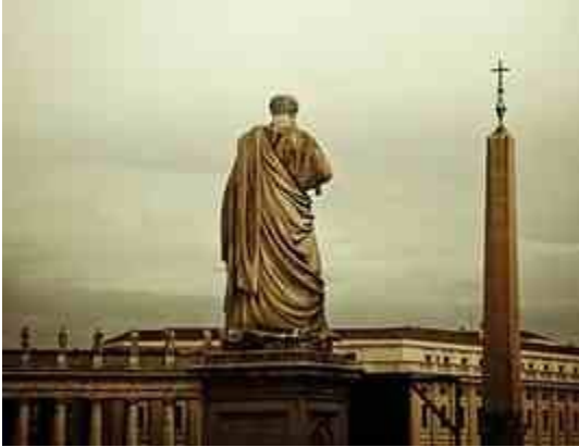
A grande conspiração tem como alvo a cátedra de Pedro. Os taques são feitos a partir de dentro e de fora

“Existe um grupo de planejadores que pretendem implantar uma república universal. Seu propósito consiste em eliminar lentamente a verdadeira Igreja de Jesus”