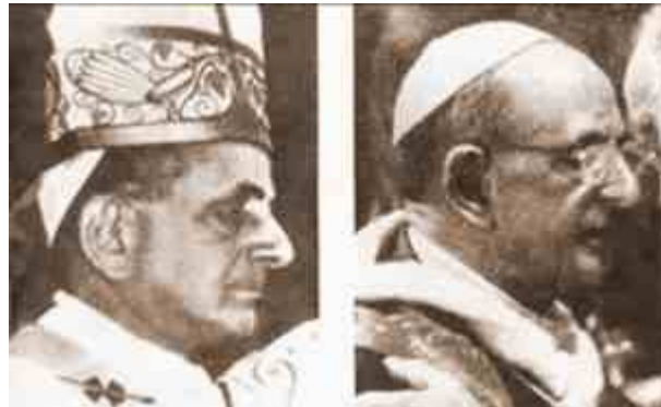
Em 27 de setembro de 1975, para estardalhaço de todos, a Senhora mencionou que na cátedra de Pedro havia “um impostor criado a partir das mentes dos agentes de Satanás” assumindo o lugar de Paulo VI

“Ao redor dele, os inimigos preparam sua queda. Através dos meios de informação —vossos jornais, vossas emissoras de rádio e este agente chamado de televisão— os inimigos conseguirão imprimir graves erros, entrevistas falsas, conceitos errôneos e mentiras”.