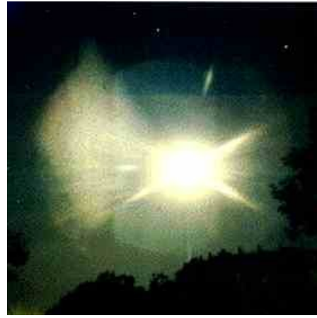
Em 18 de junho de 1986, durante a vigília de orações, mil e quinhentas pessoas foram testemunhas do “milagre do sol”

Em 18 de junho de 1986, durante a vigília de orações, mil e quinhentas pessoas foram testemunhas do “milagre do sol” que girou exatamente como ocorrido no episódio de Fátima.