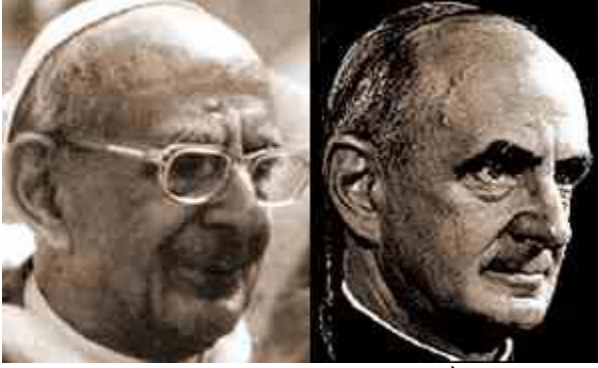
Na foto à esquerda, o papa impostor. À direita, o verdadeiro Paulo VI